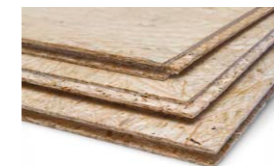
AGEPAN® OSB 4 N+F Ecoboard®