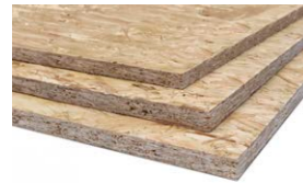
AGEPAN® OSB 3 Ecoboard®