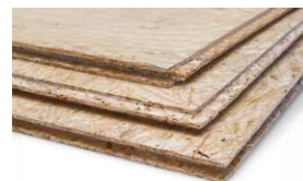
AGEPAN® OSB 3 N+F Ecoboard®